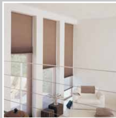
Type 12 A: Nat og dag