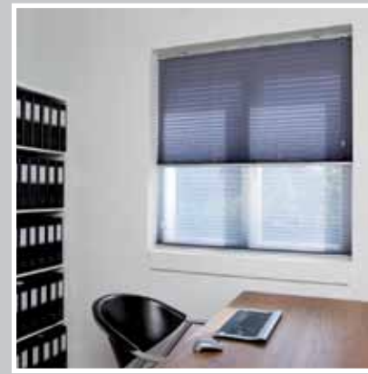
Type 12 A: Nat og dag