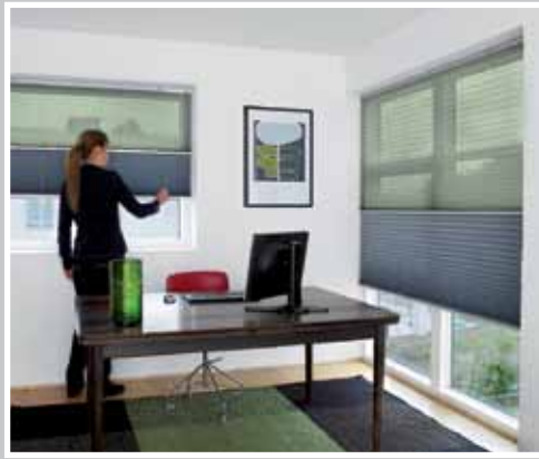
Type 12 A: Nat og dag