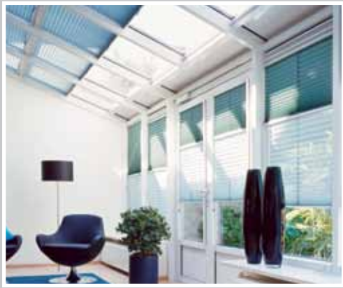
Type 3: Ovenlys vinduer. Type 12 A: Nat og dag